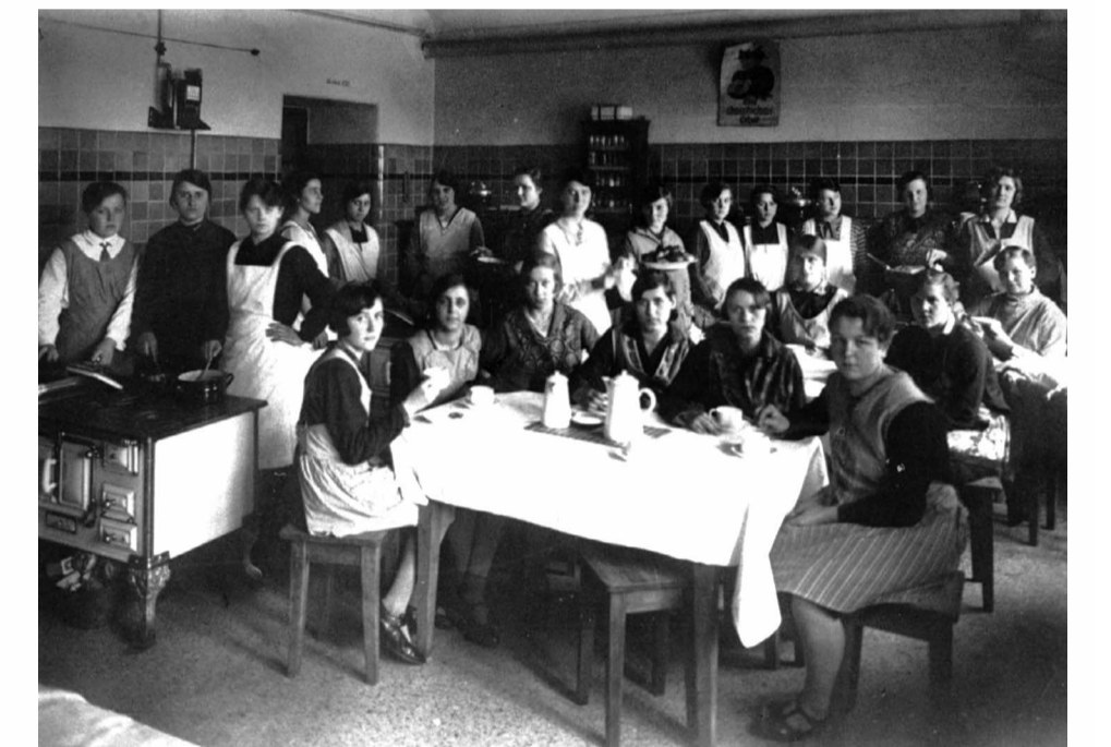
Eine Mädchenklasse im Hauswirtschaftsraum der Luzenbergschule, 1927.

Wenige Jahre nach seiner Fertigstellung wird der Turm um zwei im rechten Winkel zueinander stehende, dreigeschossige Seitenflügel ergänzt, die seit 1915 die Luzenbergschule beherbergen.