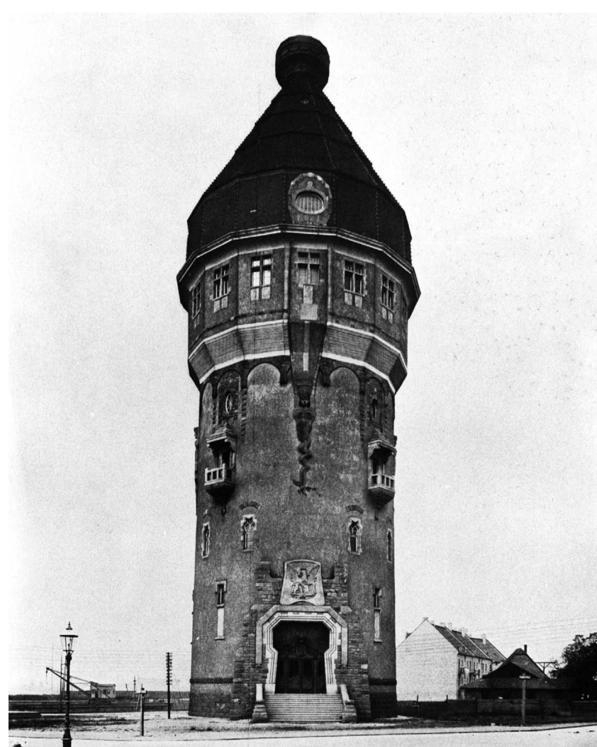
Das ursprünglich steile und im 2. Weltkrieg zerstörte Dach des Wasserturms mit einem Knauf als Bekrönung, das auf diesem Foto von 1909 gut zu erkennen ist, wird im Zuge der Generalinstandsetzung 1977 aus Kostengründen durch eine flachere Dachkonstruktion ersetzt.

Weiterführende Informationen: www.mannheim.de