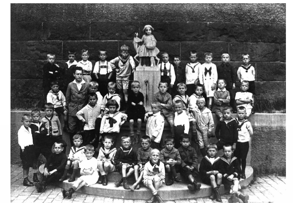
Erstes Schuljahr 1925/26: Jungenklasse vor der Brunnenfigur.