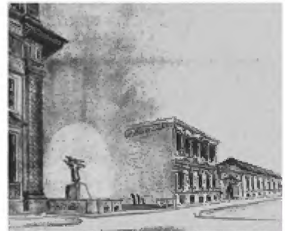
Entwurfszeichnung zur Aufstellung in B 4.