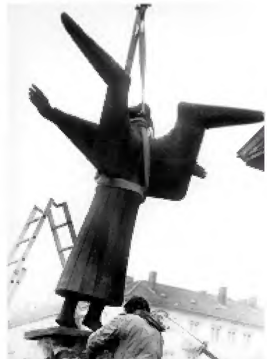
Demontage des Friedensengels in B 4, 1983.