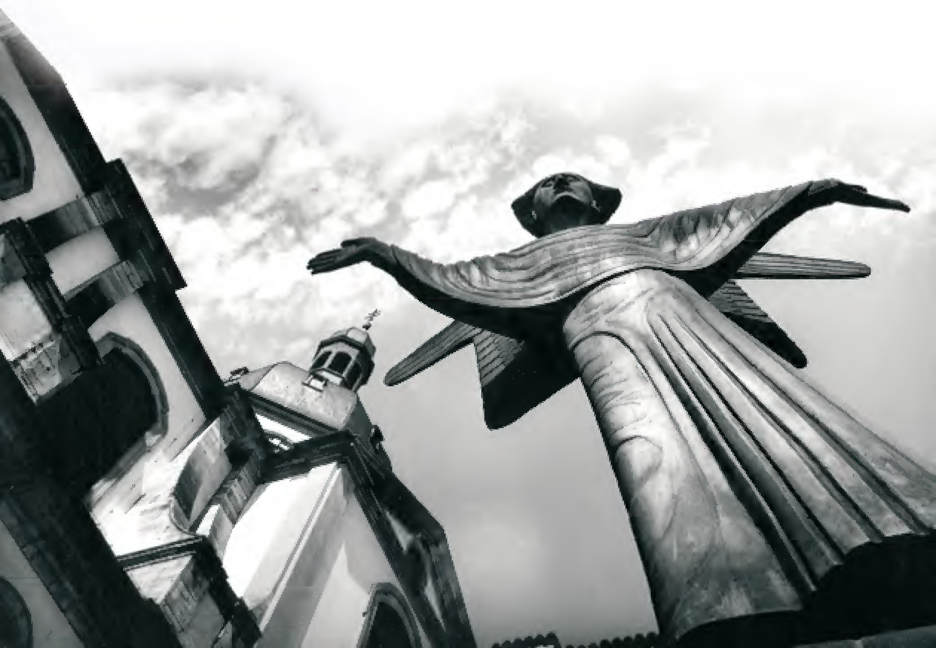
Der Friedensengel und die Jesuitenkirche in einer künstlerischen Fotografie von Robert Hüusser, um 1900.