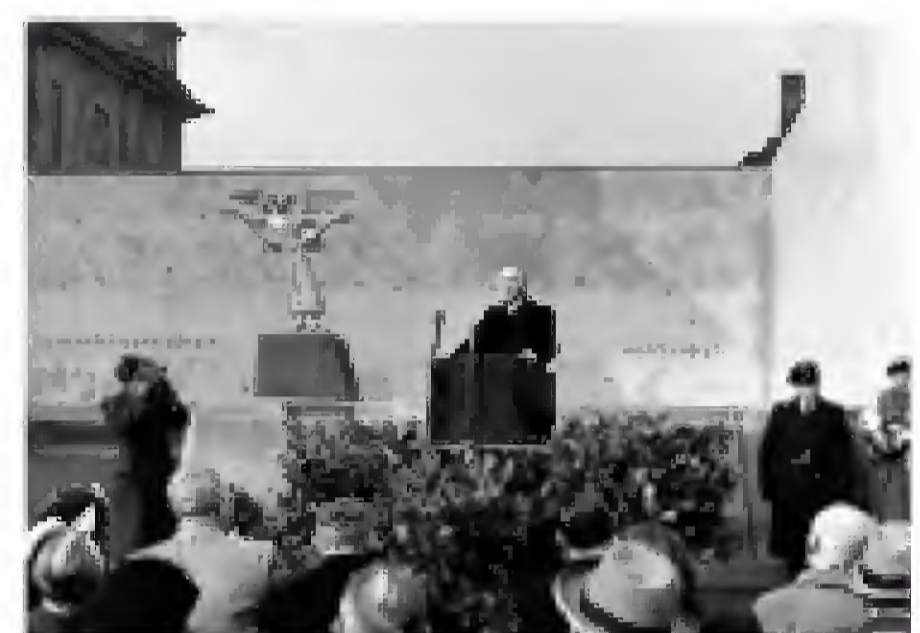
Bundeskanzler Konrad Adenauer bei der Einweihung des Friedensengels, 1952.