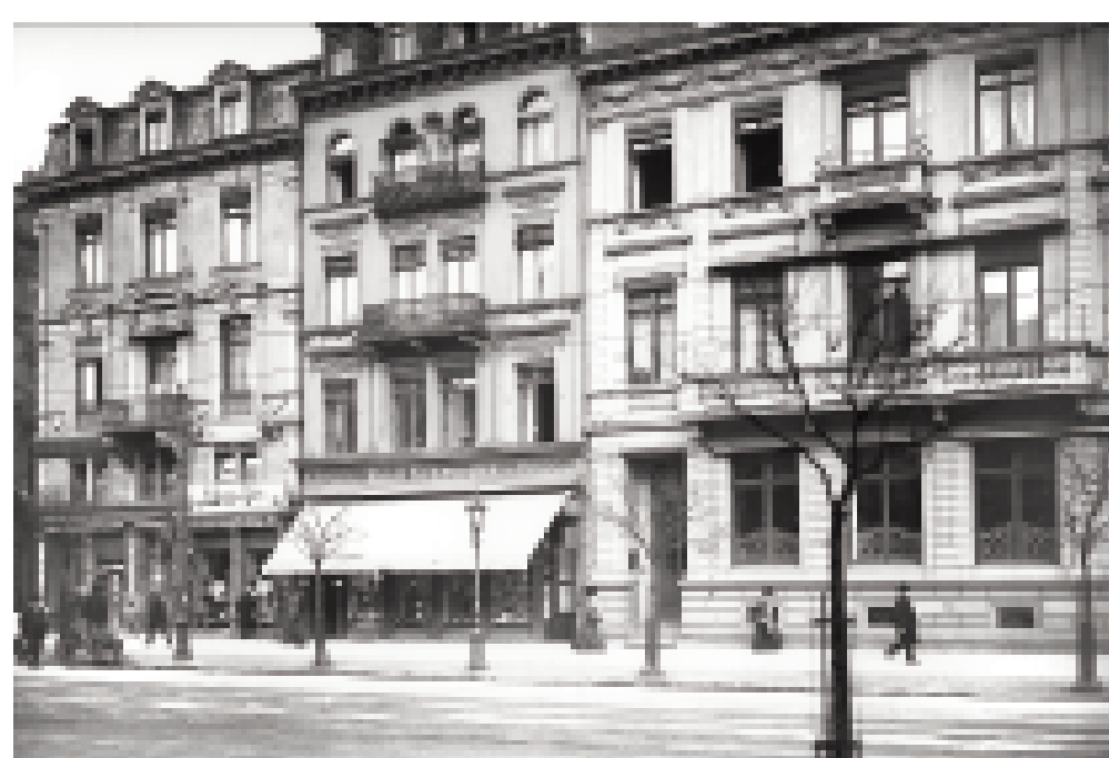
Die Häuserzeile E 3, 14-16, um 1906.