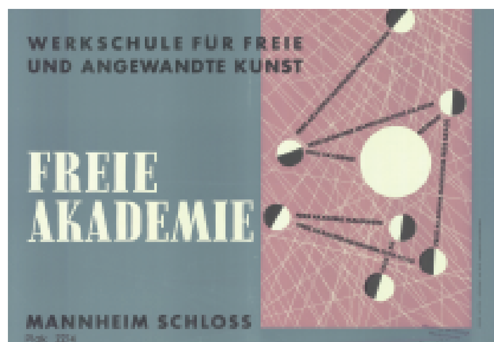
Nach dem 2. Weltkrieg nimmt die „Freie Akademie“ 1946 ihre Arbeit wieder auf und ist von 1950 bis 1964 im linken Flügel des Schlosses untergebracht. Plakat von 1961.

Weiterführende Informationen: www.mannheim.de