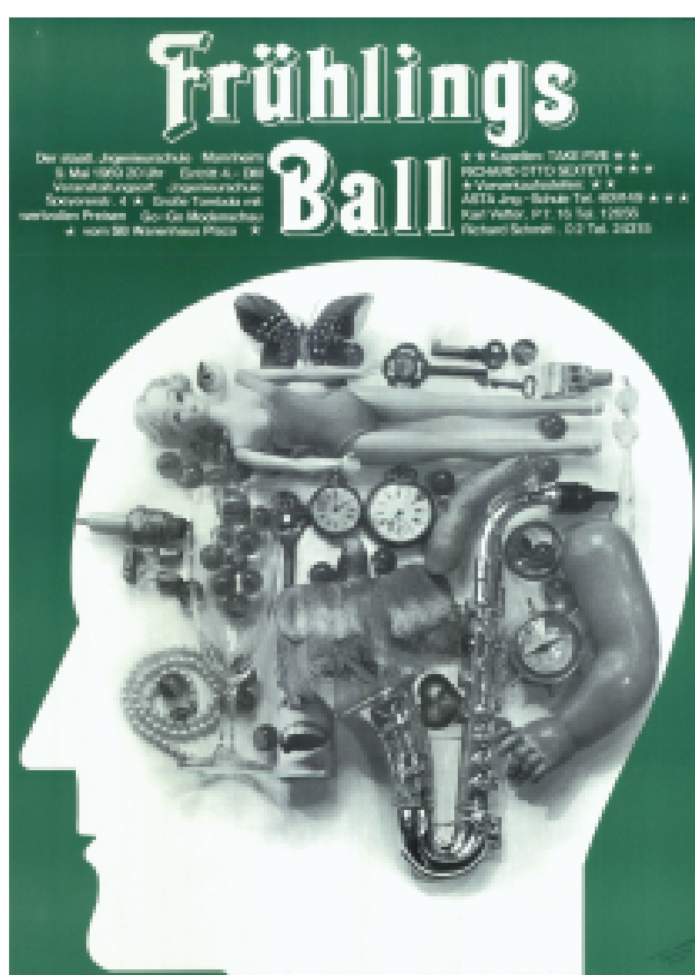
Plakat für den Frühlingsball der Ingenieurschule, gestaltet von Jürgen Richter von der „Werkkunstschule“, 1969. Inzwischen haben beide Einrichtungen ihre Heimat unter dem Dach der Hochschule Mannheim gefunden.