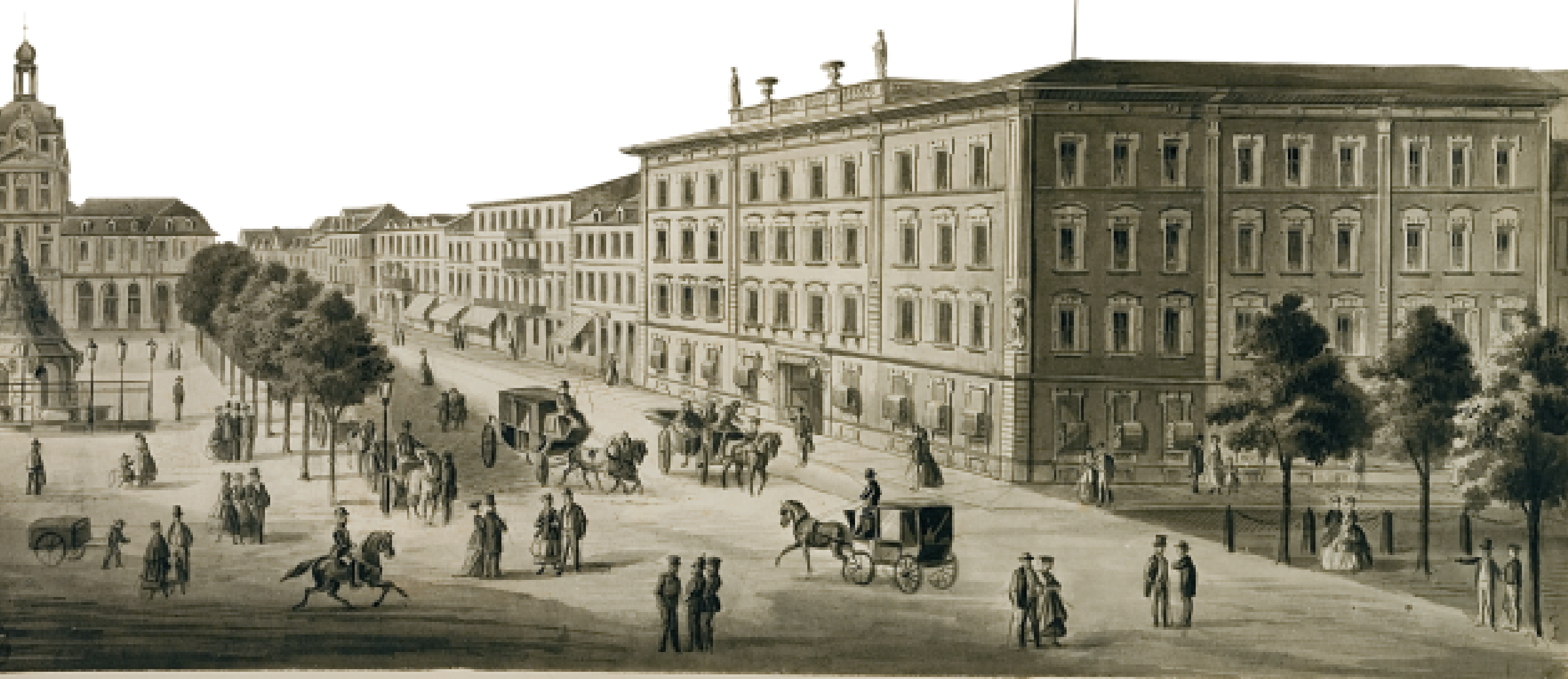
Der „Pfälzer Hof“ im 19. Jahrhundert. Das Gebäude wird bis 1929 als Hotel genutzt.

Weiterführende Informationen: www.mannheim.de