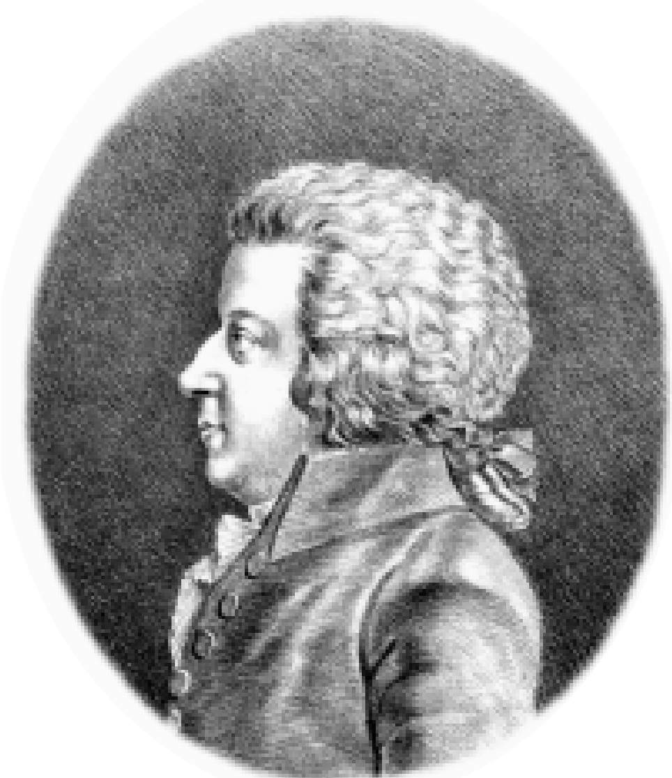
Wolfgang Amadeus Mozart (1756–1791) hält sich insgesamt vier Mal in Mannheim auf. Sein längster Besuch währt vom 30. Oktober 1777 bis zum 14. März 1778. In dieser Zeit versucht er vergeblich eine Anstellung bei Kurfürst Karl Theodor (1724–1799) zu erhalten. Er kann aber vielfältige Kontakte zu den Musikern der Hofkapelle knüpfen, die als „Mannheimer Schule“ europaweit einen hervorragenden Ruf genießen.