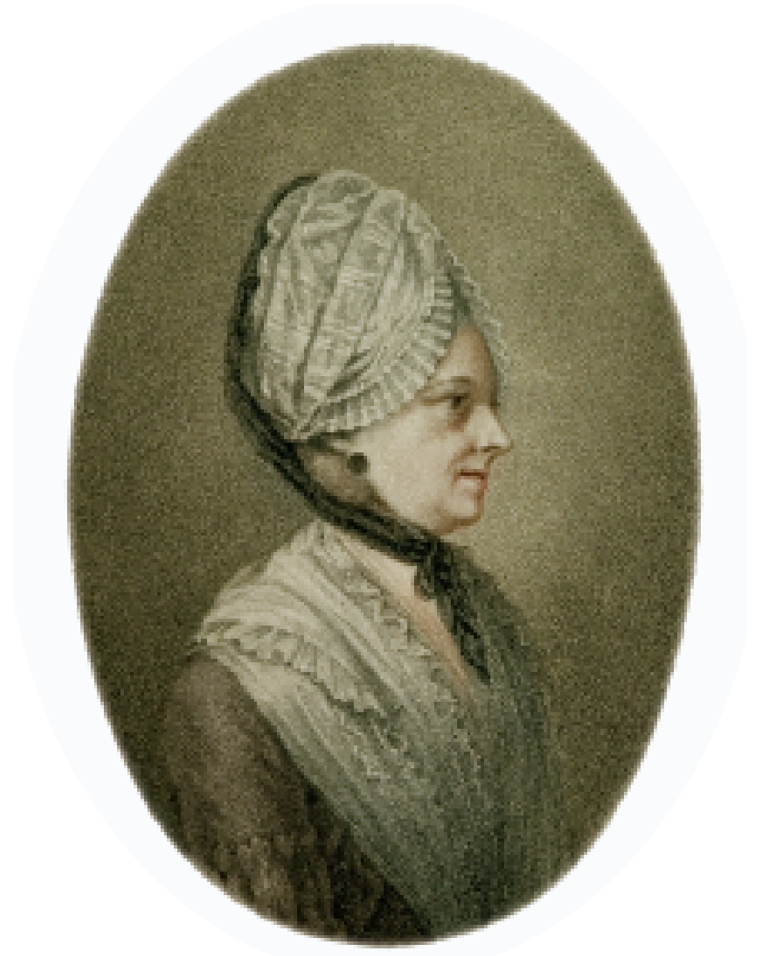
Die Schriftstellerin Sophie von La Roche (1731–1807) besucht die Stadt oft und veröffentlicht 1791 im Mannheimer Verlag Schwan und Götz das Buch „Briefe über Mannheim“, in dem sie die Vorzüge der Stadt mit guter Beobachtungsgabe und viel Sympathie schildert.