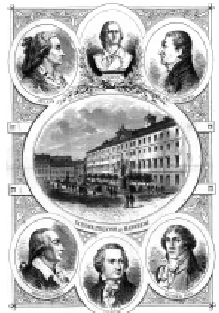
Auf dem Gedenkblatt zum 100-jährigen Bestehen des Nationaltheaters ist neben Wolfgang Heribert von Dalberg (1750-1806) und August Wilhelm Iffland (1759-1814) auch Friedrich Schiller (1759-1805) abgebildet, dessen Schauspiel „Die Räuber“ 1782 hier seine Uraufführung erlebt.