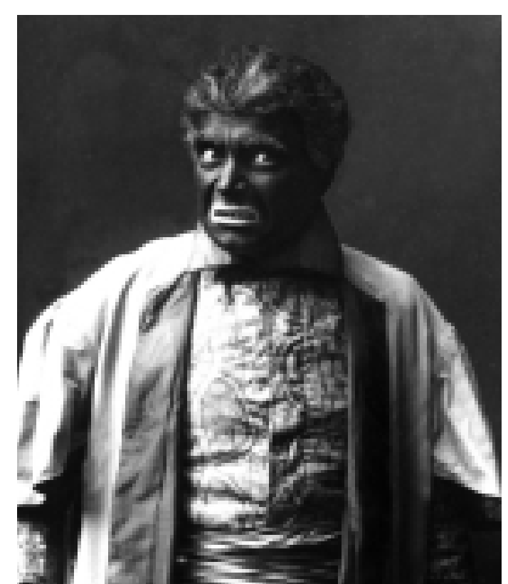
Der Schauspieler Albert Bassermann (1867-1952), ein gebürtiger Mannheimer, ist 1894/95 am Nationaltheater engagiert, bevor er sich in Berlin einen großen Namen macht. 1911 erhält er den legendären Iffland-Ring.