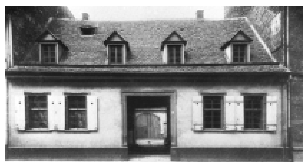
Im 18. Jahrhundert wird auf T 2, 14 ein eingeschossiges Gebäude errichtet, wie es das Foto von 1910 noch zeigt. 1926 lässt es die Stadt Mannheim, der dieses Haus damals gehört, im Stil des 18. Jahrhunderts aufstocken.